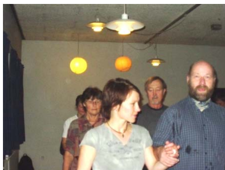
Der danses livligt til musikken

Det var specielt dejligt at se, at så mange havde fundet vej til vores lokaler igen - der var på et tidspunkt FIRE kvadriller på gulvet - pragtfuldt at se så mange glade mennesker.