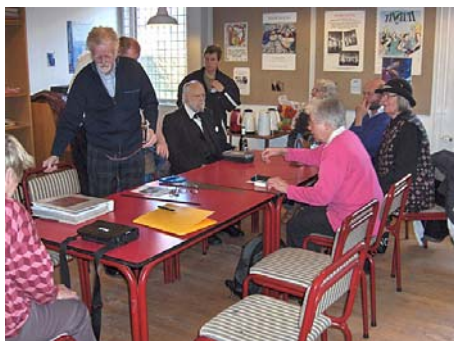
Generalforsamling i KFMH