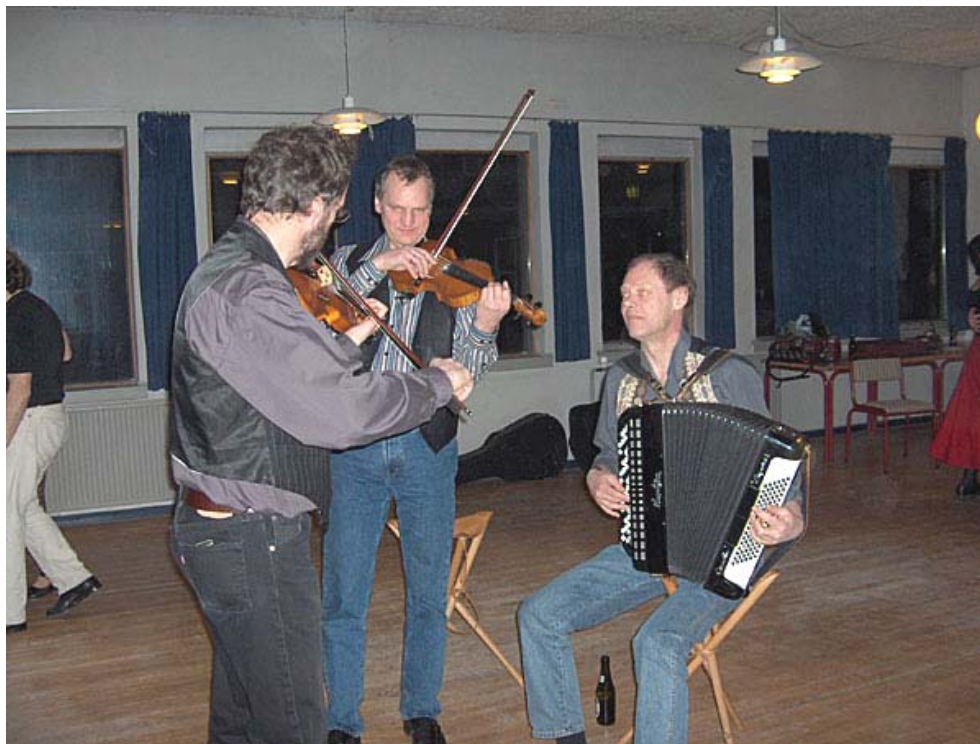
Vanløse Almindelige Danseorkester den 5.3.2005