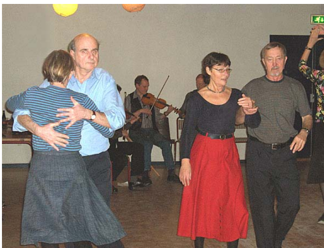
Igen dansevenlig spillemandsmusik